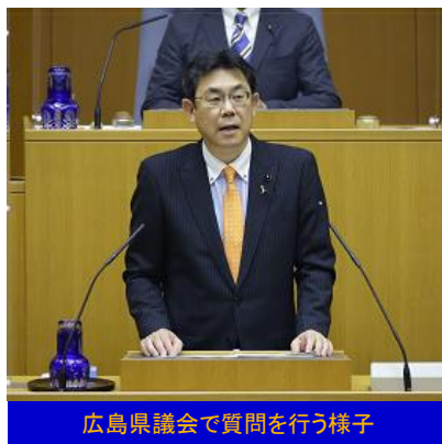
広島県議会で質問を行う様子