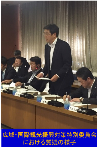
広島・国際観光振興対策特別委員会 における質疑の様子