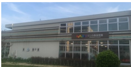
荒川区の公園内保育所「いちの森保育園」

3月26日から28日にかけて、所属会派の民主県政会で県外調査を行いました。東京都荒川区における国家戦略特区制度を活用した公園内保育所の整備状況や、静岡県藤枝市におけるIoTを活用した実証実験を通じた産業競争力の強化や人材育成の取り組みについてなどを調査しました。